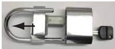
Photo n° 1

(5) Réunissez les deux parties du boîtier du cadenas et serrez les deux vis. Remettez l'obturateur en caoutchouc dans le trou le plus petit.